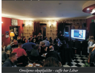
Omišjeno okupljanje - caffè bar Libar