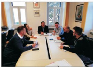
Sastanak s načelnikom i predsjednikom Općinskog vijeća