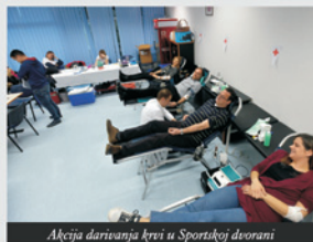
Akcija darivanja krvi u Sportskoj dvorani