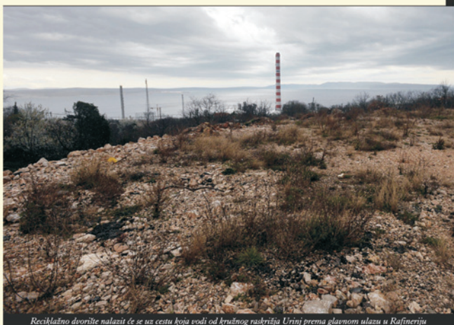
Reciklažno dvorište nalaziti će se uz cestu koja vodi od kružnog raskrižja Urinj prema glavnom ulazu u Rafineriju

Reciklažno dvorište za koje je u listopadu prošle godine dobivena građevinska dozvola, nalaziti će se na parceli površine 2.642 četvorna metra, uz prilaznu cestu koja vodi od kružnog raskrižja Urinj prema glavnom ulazu u Rafineriju nafte Rijeka. Reciklažno dvorište uključuje ograđen plato veličine 959 četvornih metara na kojem će se nalaziti 32 spremnika za različite kategorije otpada, zatim vaga, uredski kontejner i