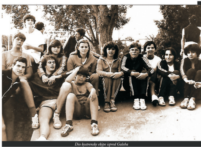
Dio kostrenske ekipe upred Galeba