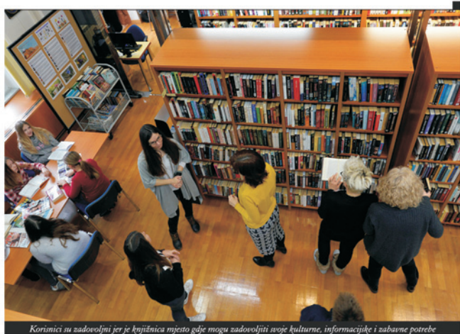
Korisnici su zadovoljni jer je knjižnica mjesto gdje mogu zadovoljiti svoje kulturne, informacijske i zabavne potrebe