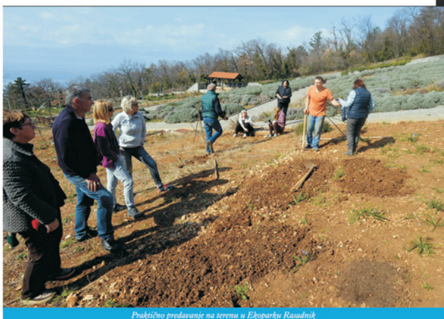
Praktično predavanje na terenu u Ekoparku Rasadnik

- Tranzicijska inicijativa neformalno je udruženje građana koje zastupa drugačiji pristup svim našim životnim aktivnostima, kao put u bolje i sretnije društvo. Ne može se ograničiti na ekološki ili ekonomski aspekt jer su u fokusu i ljudski odnosi, obrazovanje, općenito odnos prema životu. Početak suradnje s udrugom Ekoregija dogodio se kroz Zelenu kostrensku samanju koji se već drugu godinu zaredom zadnje srijede u mjesecu održava u predvorju Sportske dvorane