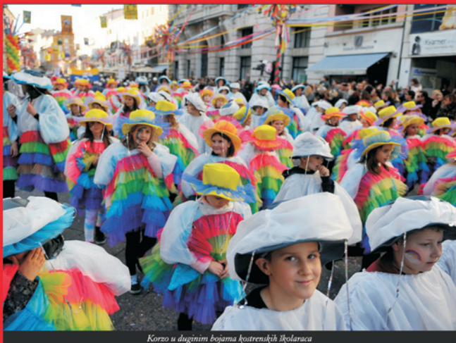
Korzo u duginim bojama kostrenskih školara