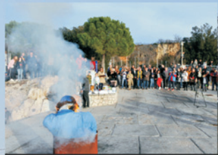
Mičel je i ove godine sve grijeh platilo u dimu