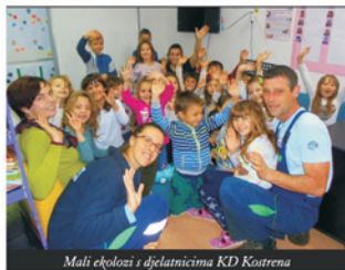
Mali ekolozi i djelatnicima KD Kostrena

Ekološke aktivnosti obuhvatile su i aktivnu ulogu u životinjskom svijetu te su u suradnji s Udrugom Vali predškolci izrađivali keramičke hranilice, kućice i ptičice koje će biti postavljene u okolišu vrtića. Hranilice i kućice imat će više funkcija: ptičicama će omogućiti izvor hrane i skrovište u hladnim zimskim danima, a djeci će poslužiti kao pozitivan