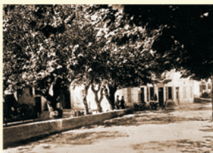
Martinšćica, 1925. godine. Najstarija pronađena slika gostionice Čabrijan, uz cestu Dorotheu (danas magistralna cesta). Lijevo, uz rub ceste, je prostor ureden za ljetnu sezonu i jog-bočarija. Desno, uz zgradu, je manja prizemnica, tadašnja mesnica.

Martinšćica, 1926. godine. Razglednica, naklada S. Riemer - Sušak. Gostionica je slikana s istočnog dijela stare makedamske ceste za Kostrenu. Lijevo, između ceste i visokog ogradnog zida starog lazareta, je korito potoka Javor, a desno zgrada koju je prestankom rada mlina preuzela sušačka obitelj Vilhar i tu izgradila pogon pilane. Iznad gostionice vidi se krov manje stambene zgrade Čabrijanovih, a preko pilane nazire se krov jednokatnice obitelji Vičić. Po sredini, uzbrdo je dio iste godine izgrađenih stuba što preko Bobova vode u Podvezicu.