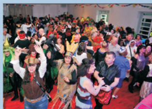
Čak sedam subota i jedan petak ludovalo se u Čitavonici