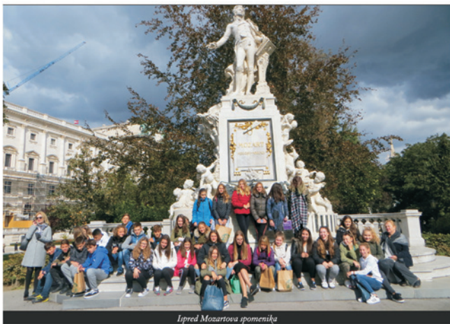
Ispred Mozartova spomenika

zreda. Za najuspješnije učenike i mentore Katedra Čakavskog sabora Grobnišćine organizirala je nagradni edukativni izlet „Na tragu naših starih“ kojim je posjećen Novi Vinodolski i njegove znamenitosti. Učenici su izlet ocijenili