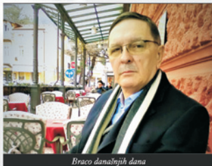
Braco današnjih dana

Kako san imel i te organizacijske sposobnosti, povukli su me va kancelariju JPS-a pa san ko šef agencije razvijal agenciju i kompaniju kako san najbolje znal i mogal na ten turbulentnon tržištu po-