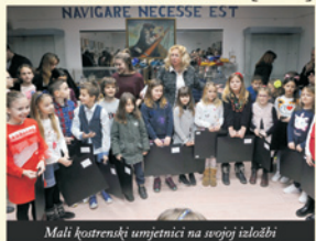
Mali kostrenski umjetnici na svojoj izložbi