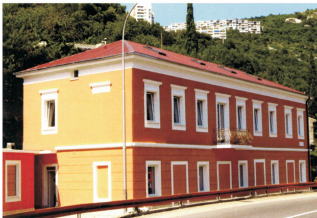
Martinšćica, 2002. godine. Ovakvo danas izgleda obnovljena zgrada nekadašnje „Čabrijanke“ koju su novi vlasnici preuredili u svratište s više soba, a u prizemlju (lijevo) ureden je ugostiteljski lokal.