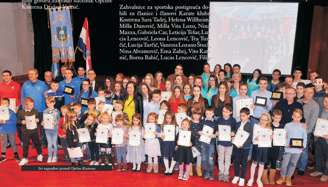
Svi nagrađeni sportaši Općine Kostrena