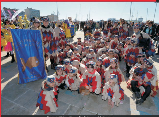
Sovice iz Zlatne ribice na Dječjoj karnevalskoj povorci