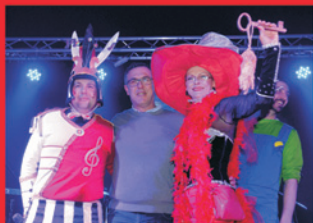
Ključevi Općine u rukama Špažičara