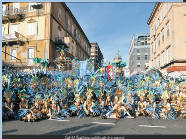
Čak 95 Špažičara sudjelovalo je u povorci