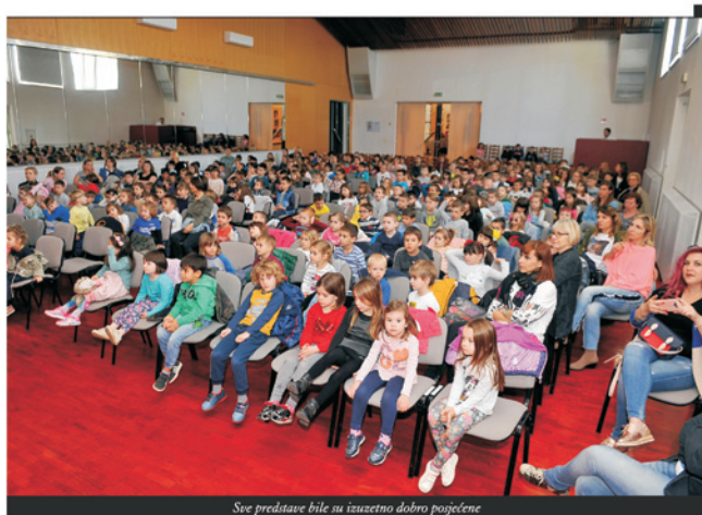
Sve predstave bile su izuzetno dobro posjećene