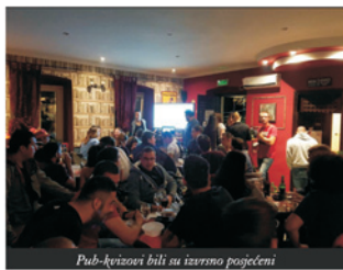
Pub-kvizovi bili su izvrsno posjećeni

[ Od planova za 2019. valja izdvojiti još jedan pub kviz tijekom travnja, karaoke u svibnju te sportsko događanje početkom ljeta. U tijeku je anketiranje mladih kako bi se ustanovila potreba za organiziranim noćnim prijevozom vikendom iz Rijeke ]