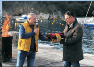
Načelnik je dobio natrag ključeve Općine