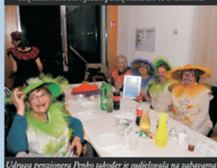
Udruga penzionera Penko sakoder je sudjelovala na zabavama