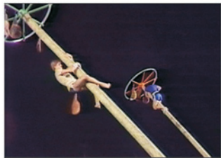
Penjanje na jarbol po prište