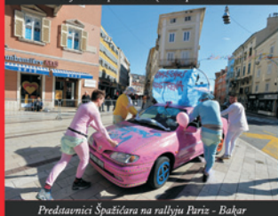
Predstavici Špažičara na rallyju Paris - Bakar