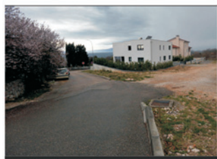
Izgradnja stambene ceste u Šoićima će 5,4 milijuna kuna bez PDV-a

Investicija je procijenjena na 5,4 milijuna kuna bez PDV-a, od čega će Vodovod i kanalizacija iznositi od 1,5 milijuna kuna financirati gradnju vodovoda i sanitarne kanalizacije iz sredstava naknade za razvoj vodoopskrbe i odvodnje na vodoopskrbnom području Općine Kostrena, dok će Općina Kostrena fi-