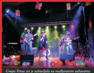
Grupa Venus sve je zabavljala na maškaranim zabavama