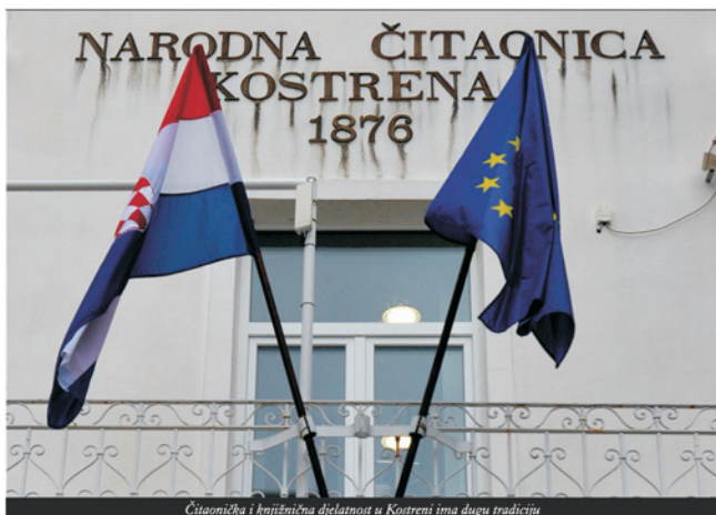
Čitaonica i knjižnična djelatnost u Kostreni ima dugu tradiciju

čitaonička djelatnost. Brižljivim odabirom knjižnične građe za sve korisnike, uz redovita sredstva iz općinskog proračuna i proračuna Ministarstva kulture, knjižnica je veličinom fonda brzo uspjela doseći propisane standarde.