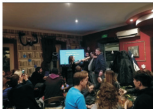
Na karaokeu je organizirana humanitarna tombola