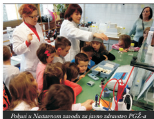
Poljazi u Nastavnom zavodu za javno zdravstvo PGŽ-a

primjer aktivnog uključivanja u svijet prirode te će promatrajući ptice imati poticaj za kreativno stvaranje. Vrtić se i ove godine planira uključiti u inicijativu Ekoregije Kostrena putem koje će djeca naučiti saditi i njegovati biljke koje će dobiti za recikliranje pet plastičnih vrećica. Tom se inicijativom nastoji od malih nogu njegovati ekološki duh te poticati ljubav prema prirodi i okolišu. Stoga