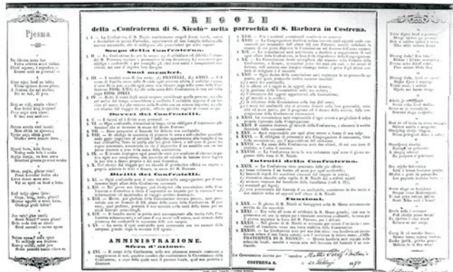
Pisana pravila Bratovštine iz 1870. godine

Bratovština sv. Nikole u Kostreni Sv. Barbari.