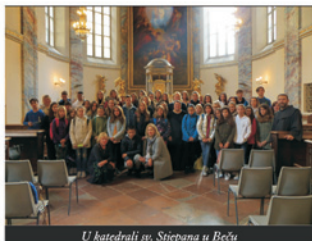
U katedrali sv. Stjepana u Beču