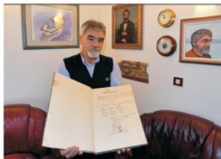
Prvi supisnik nakon osnivanja Bratovštine iz 1869. godine

Barbarani su tako pomagali svojim sumještanima koje je snašla nesreća sve do pred kraj 19. stoljeća kad je Austro-ugarska svojim kapitalom pomogla pa-