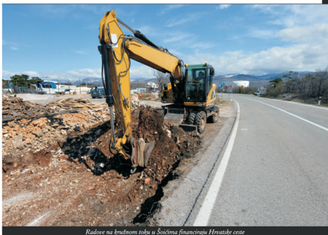
Radove na kružnom toku u Šoićima financiraju Hrvatske ceste

[ Investicija gradnje kružnog toka je vrijedna oko dva milijuna kuna bez PDV-a, a uključuje rekonstrukciju postojeće državne ceste D8 izgradnjom novog kružnog raskrižja s oborinskom odvodnjom te gradnju dviju novih autobusnih stanica na Jadranskoj magistrali ]