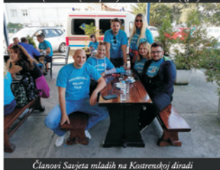
Članovi Savejeta mladih na Kostrenskoj dtradi

bolu za Boćarski klub osoba s invaliditetom Pulac. I ovaj je događaj organiziran u prostoru caffè bara Libar. Zabava je potrajala više od tri sata uz rasprodanu tombolu.