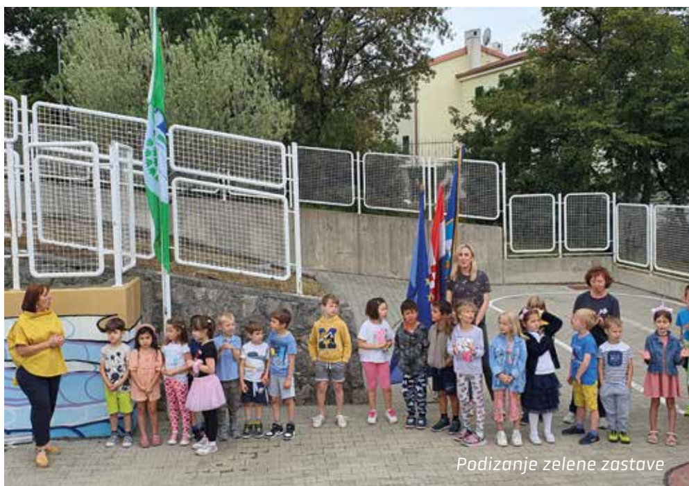
Podizanje zelene zastave