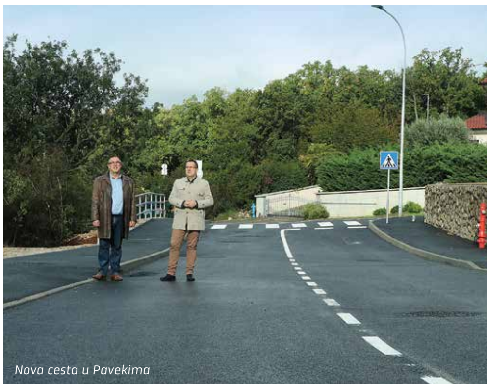
Nova cesta u Pavekima

Kapitalne projekte i izgradnju, gdje god je to moguće, prati nova cestovna i komunalna infrastruktura poput spojne ulice kojom su napokon povezane Šojska i Žarka Pezelja, kako bi se postigla bolja protočnost prometa kroz naselje Paveki. Nova dionica duga je oko 120 metara i namijenjena dvosmjernom prometu, s obustranim nogostupom kao i pripadajućom infrastrukturom. Riječ je o infrastrukturnu zahvatu vrijednom 1,5 milijuna kuna na koji se zbog složenih imovinsko-pravnih odnosa dosta dugo čekalo. Tek nešto dalje otvoreno je gradilište za cestu koja će povezivati Paveke s naseljem Perovići. U tijeku je i polaganje vodovodne i kanalizacijske mreže za potrebe budućeg doma za starije osobe u Pavekima čija je izgradnja u razvojnim planovima Općine.