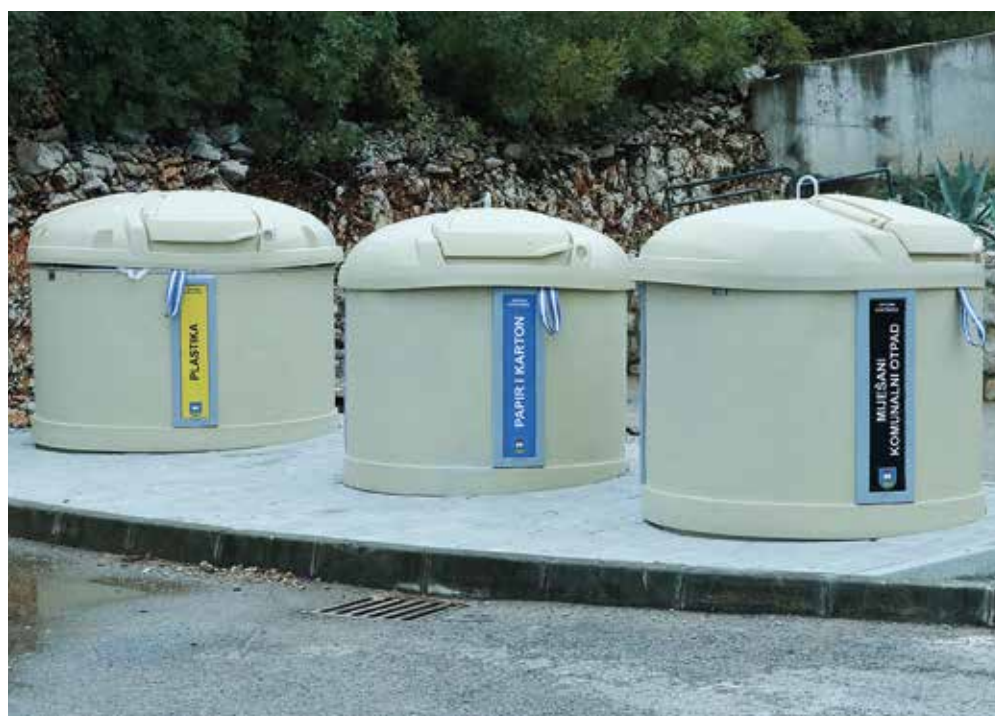
Poluukopani spremnici za otpad