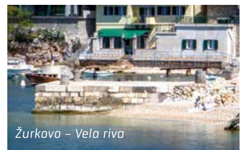
Žurkovo – Vela riva