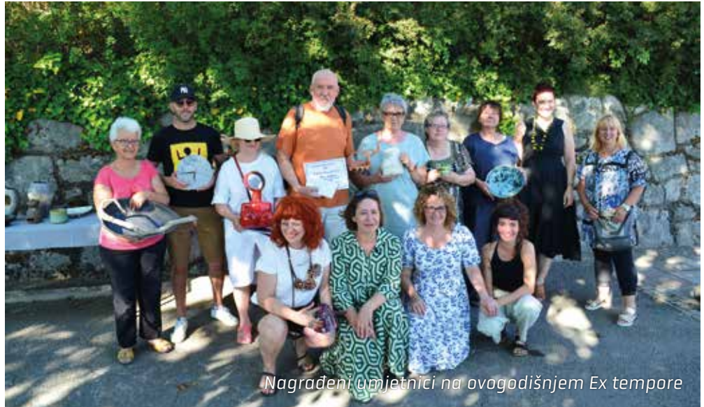
Nagrađeni umjetnici na ovogodišnjem Ex tempore

Članovi Udruge Vali sudjelovali su na međunarodnoj izložbi Udruge Poc u Ajdovščini u Sloveniji, a tijekom ljeta marljivo su radili i dovršili ukrašavanje zida kod Sportske dvorane Kostrena čime su dovršili projekt koji je započeo prijašnjih godina. Pritom su oblikovali novi val te uredili stari zid, a zatim su uredili i onaj na plaži ispod kafića „Me gusta“ na obalnom putu.