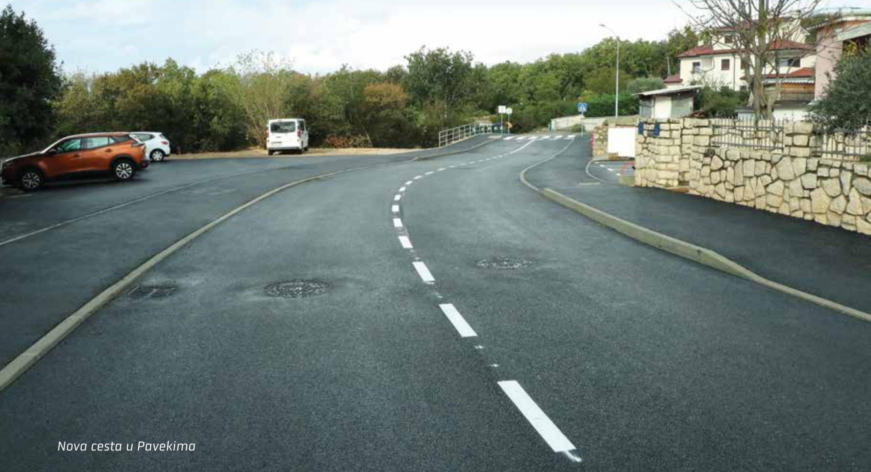
Nova cesta u Pavekima

KOMUNALNI PROJEKTI ■ Realizirani veliki i važni kapitalni projekti