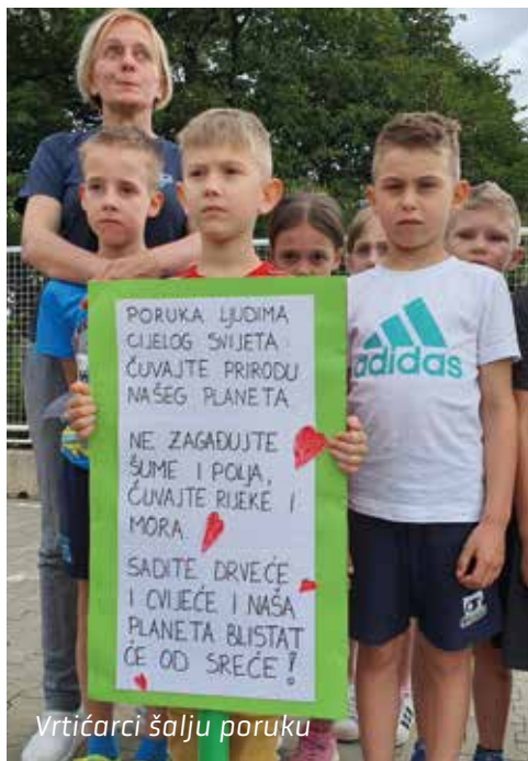
Vrtićarci šalju poruku

Za roditelje organiziramo ciklus radionica odgovornog roditeljstva "Rastimo zajedno", a za buduće školarce i njihove roditelje radionice "Volim vrtić, volim školu".