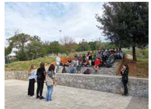
Učionica na otvorenom