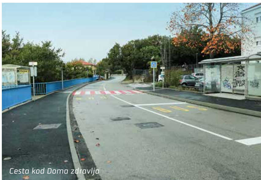
Cesta kod Doma zdravlja

Izgradnja vodovodne i kanalizacijske mreže u Doričićima, opsežan projekt vrijedan gotovo 6 milijuna kuna, završen je prije planiranog roka. – Iako su ovakvi projekti javnosti možda manje vidljivi i eksponirani u odnosu na neke druge, njihov je značaj za mještane nemjerljiv jer se napokon riješio problem s kojim su mještani Doričića bili suočeni dugi niz godina. – zaključio je načelnik Dražen Vranić.