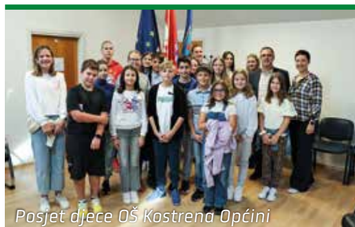
Posjet djece OŠ Kostrena Općini