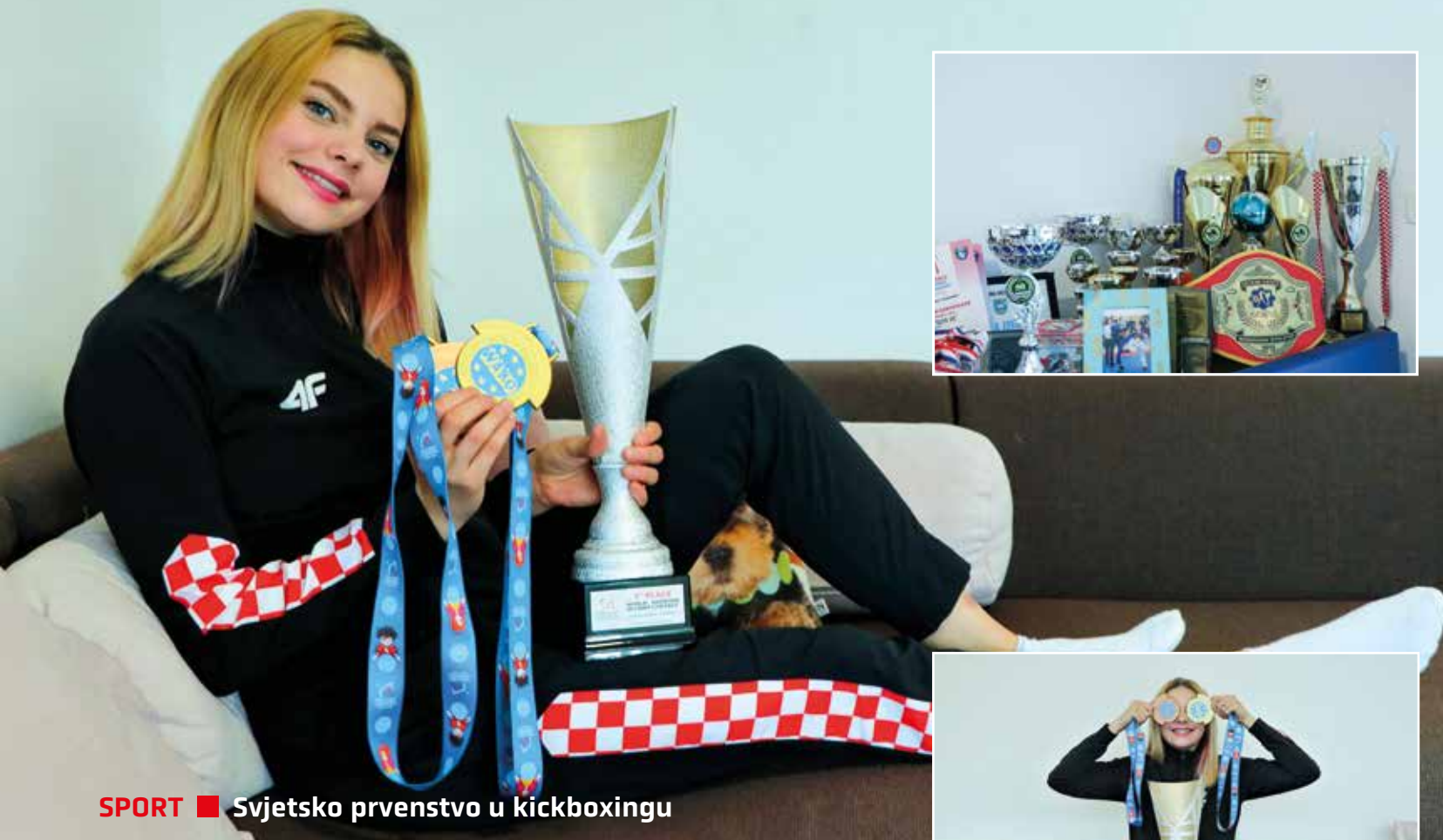
SPORT ■ Svjetsko prvenstvo u kickboxingu