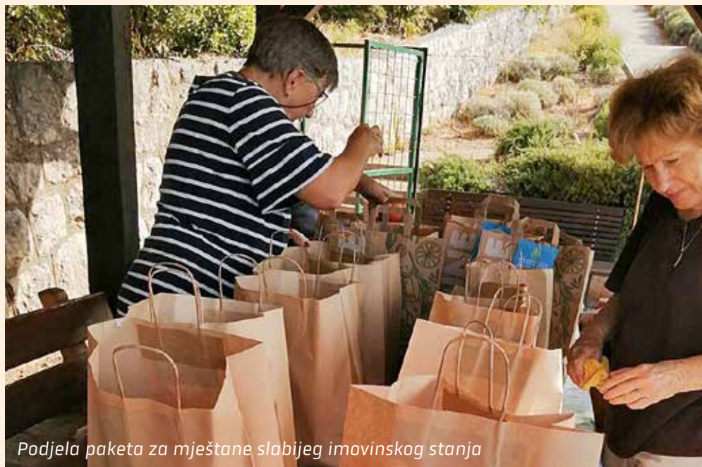
Podjela paketa za mještane slabijeg imovinskog stanja