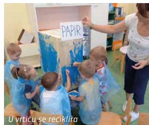
U vrtiću se reciklira

Prava prilika za bolje upoznavanje lokalne zajednice ukazuje se povodom Dječjeg tjedna, u prvom tjednu mjeseca listopada kada organiziramo mnogobrojna događanja. Ovogodišnje