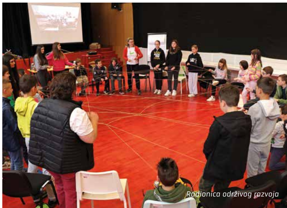
Radionica održivog razvoja

Prijavitelj i nositelj projekta Stori po svoju je Općina Kostrena, a partneri su Grad Rijeka, Grad Kraljevica i Centar kulture Kostrena. Projekt je u potpunosti financiran sredstvima iz Europskog socijalnog fonda, Operativnog programa Učinkoviti ljudski potencijali 2014.–2020. Trajanje projekta jest od veljače 2021. do veljače 2023.